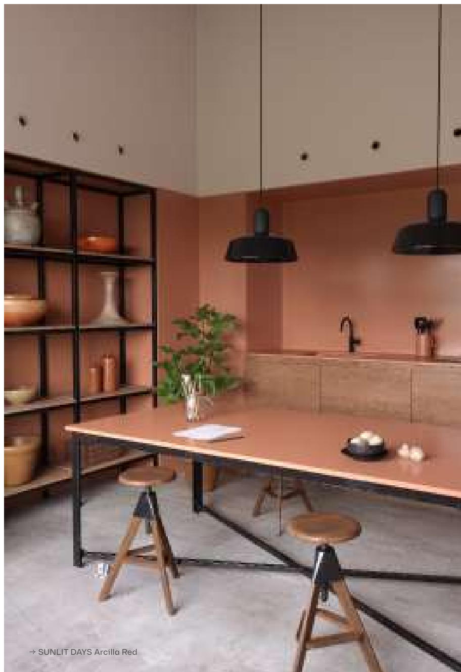
→ SUNLIT DAYS Arcilla Red