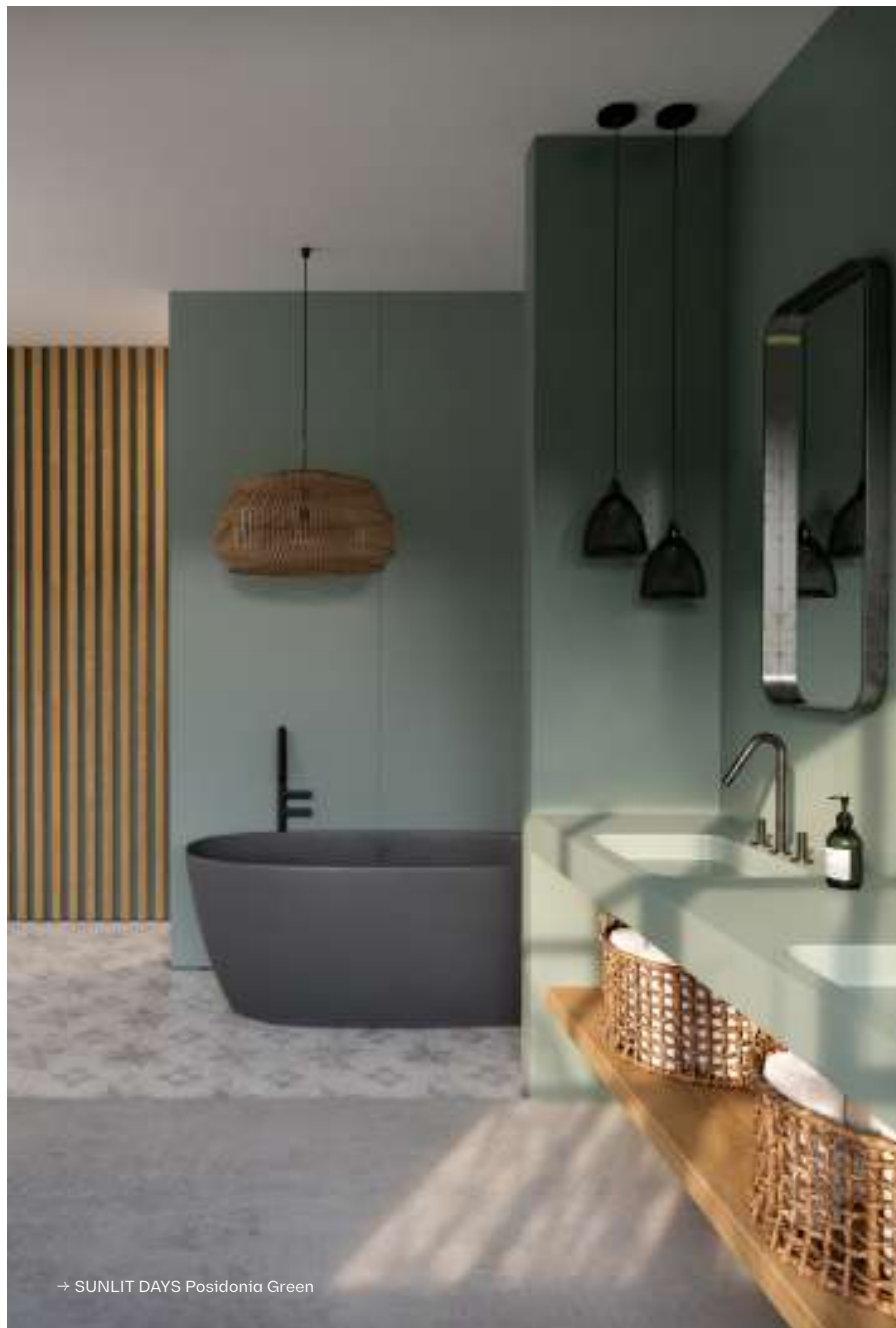
→ SUNLIT DAYS Posidonia Green